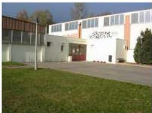
COSEC Léo Lagrange

Lieu de la compétition : Cosec Léo LAGRANGE – 335 Rue de COUBERTIN 91440 Bures sur Yvette